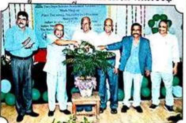
ಸಸ್ಯಶಾಸ್ತ್ರ ವಿಭಾಗದ ರಾಷ್ಟ್ರಮಟ್ಟದ ವಿಚಾರಸಂಕರಣ ಉದ್ಘಾಟನೆ