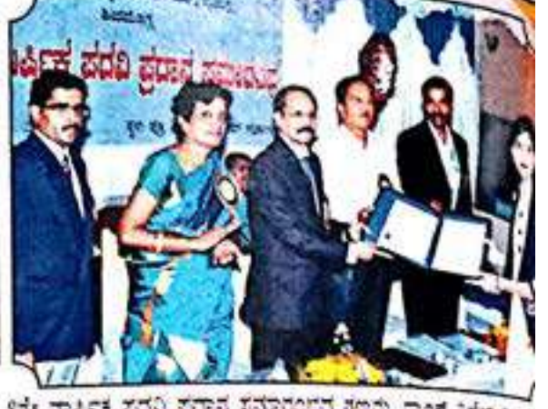
8ನೇ ವಾರ್ಷಿಕ ಪದವಿ ಪ್ರವಾಸ ಸಮಾರಂಭದ ಗಲ್ಲಾಪು, ಡ್ಯಾನ್ಸ್ ವಿಜೇತ ವಿಧಾನ