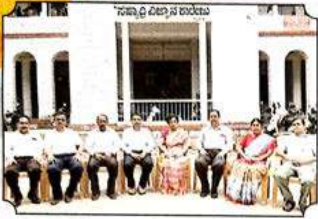
ಗ್ರಂಥಾಲಯ ಸಲಹಾ ಸಮಿತಿ