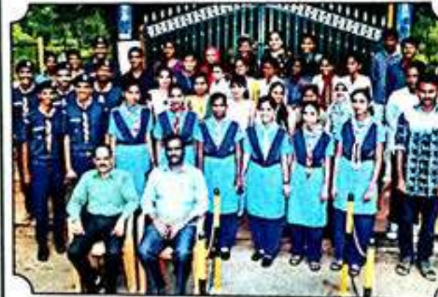
ರೇಂಜರ್ಸ್ ಮತ್ತು ರೋವರ್ಸ್ ಘಟಕದ ವಿದ್ಯಾರ್ಥಿಗಳು