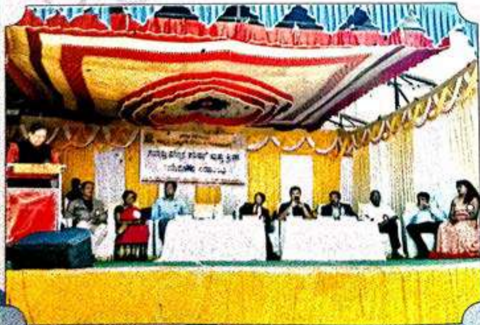
ವಿಜ್ಞಾನ ಪರಿಷತ್ ಸಮಾರೋಪ ಸಮಾರಂಭ