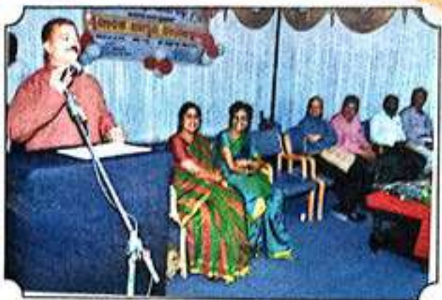
ಯುವ ರೆಡ್ ಕ್ರಾಸ್ ಘಟಕದ ವಿಶೇಷ ಕಾರ್ಯಕ್ರಮ