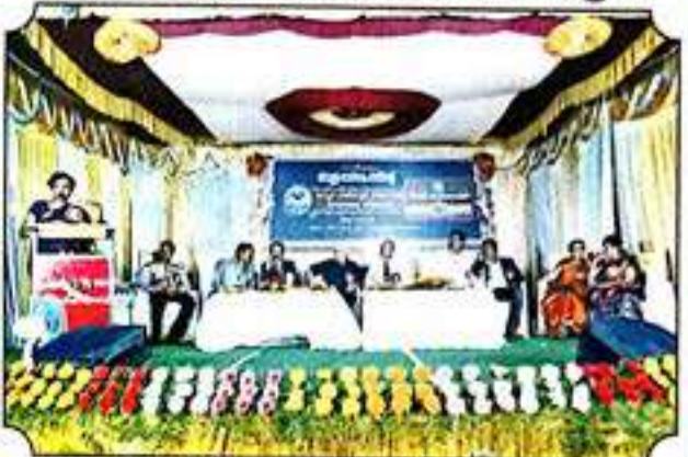
ಅಮೃತ ಮಹೋತ್ಸವ ಸಮಾರೋಹ ಸಮಾರಂಭ