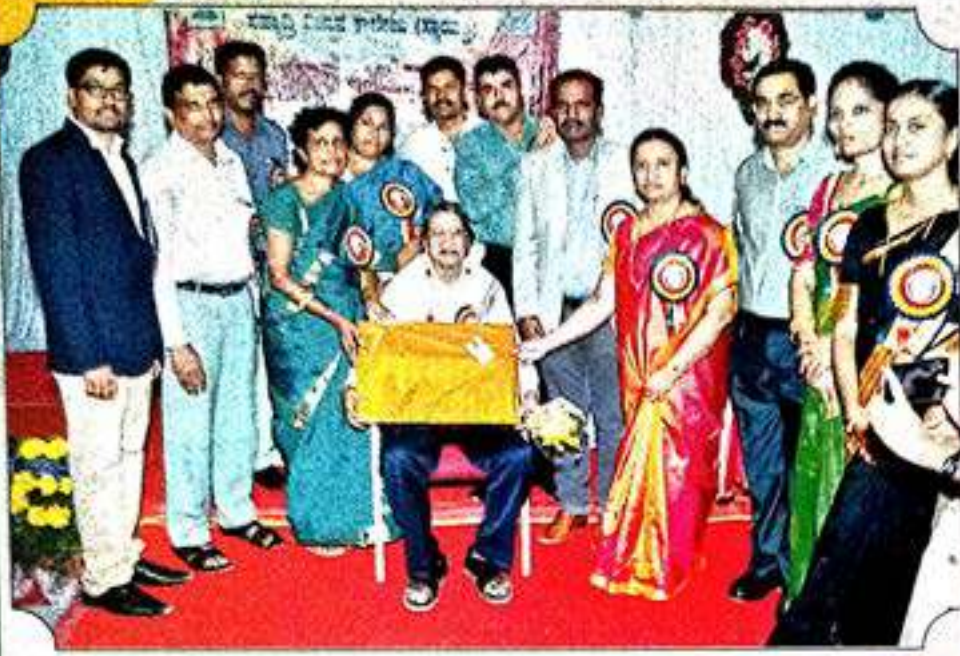
ಪ್ರತಿಭಾ ಪುರಸ್ಕಾರ ಸಮಾರಂಭ