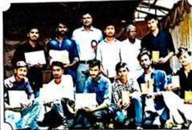
ವಿವಿಧ ಕ್ರೀಡೆಗಳಲ್ಲಿ ವಿಜೇತ ತಂಡದ ಸದಸ್ಯರೊಂದಿಗೆ ದೊಡ್ಡಗಣೇಶ್