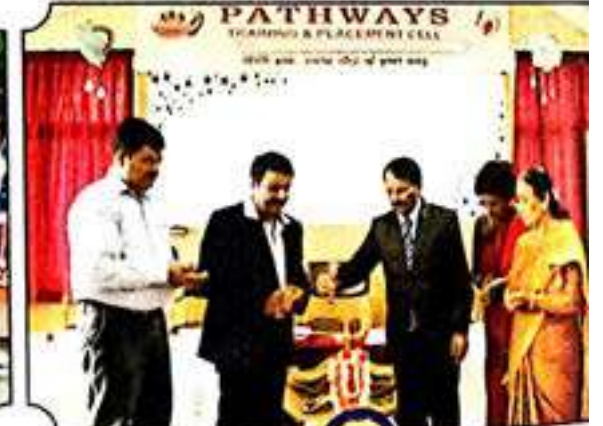
ವಾಲ್ಟೇಸ್ ವಿಭಾಗದಿಂದ ಕಾರ್ಯಾಗಾರ