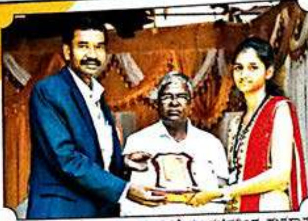
ಕ್ರೀಡಾ ಸಮಾರೋಹ ಸಮಾರಂಭದಲ್ಲಿ ಕುಲಸಚಿವರಿಂದ ಪುರಸ್ಕಾರ