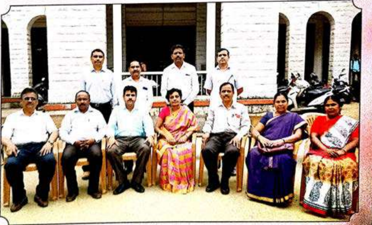
ಸಹ್ಯಾದ್ರಿ ವಿಜ್ಞಾನ ಪರಿಷತ್ತಿನ ಕಾರ್ಯಕಾರಿ ಸಮಿತಿ