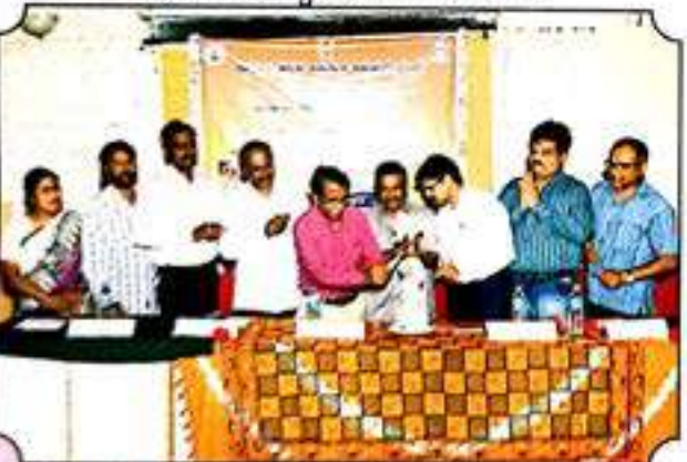
ಕನ್ನಡ ವಿಭಾಗದಿಂದ ಕಾರ್ಯಾಗಾರ