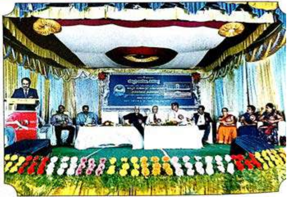
ಆಮೃತಮಹೋತ್ಸವ ವರ್ಷಾಚರಣೆ ಸಮಾರೋಪ ಸಮಾರಂಭ